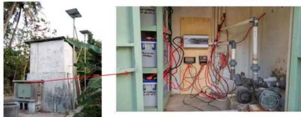
Gambar 3. Hasil Instalasi Unit Pensuplai Daya Tenaga Matahari dan Pompa Air

Bagaimanapun juga output daya listrik dari unit pensuplai daya tenaga matahari ini akan sangat bergantung dengan kondisi cuaca saat itu. Apabila seharian cuaca di lokasi mitra mendung atau tidak ada sinar matahari yang optimal tentunya unit pensuplai daya ini tidak cukup tenaga untuk menggerakkan pompa air. Jika hal ini terjadi maka pensupply daya pompa air harus di-switch ke jalur listrik PLN. Oleh karena itu perlu dirancang mekanisme switch jalur power supply ke pompa air antara mini PLTS dan PLN yang mudah dan fleksibel. Untuk keperluan tersebut digunakan saklar tuas 3 posisi (perhatikan Gambar 1). Jika tuas di posisi I maka pompa tersambung ke jalur PLN dan jika di posisi II maka pompa akan tersambung ke unit pensuplai daya tenaga matahari.