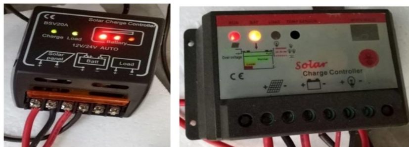
Gambar 2. SCC Nonprogrammable (Kiri) dan SCC Programmable (Kanan)

Kemudian untuk menyalurkan energi listrik dari panel surya ke media penyimpan (akumulator) diperlukan Solar Charge Controller (SCC) dengan Pulse Width Modulation (PWM) berbasis mikrokontroler. Selain itu, SCC juga berfungsi untuk mengontrol tegangan dan arus yang masuk dan keluar battery. Apabila tegangan baterai sudah mencapai batas maksimum (artinya sudah penuh), maka secara otomatis SCC akan mengurangi arus yang masuk ke battery. Hal ini untuk membuat baterai tidak panas (sehingga tidak cepat rusak). SCC juga akan memberikan informasi tentang kondisi battery apakah dalam kondisi full , normal , low ataupun empty power . SCC yang digunakan dengan spesifikasi arus maksimum 20 Ampere. Meskipun demikian, dengan mempertimbangkan kondisi riil di lapangan maka untuk mengurangi efek panas yang timbul di dalam SCC akibat arus dan suhu lingkungan yang tinggi dan juga untukantisipasi jika terjadi lonjakan arus tiba-tiba, dalam pengembangan PLTS ini digunakan dua buah SCC yang berbeda jenis fiturnya. Setiap panel surya akan masuk ke sebuah SCC, lalu kedua SCC akan mencharge larik paralel battery yang sama. Jenis pertama dari SCC adalah non-programmable SCC (Gambar 2 kiri) dan jenis kedua adalah programmable SCC (Gambar 2 kanan).